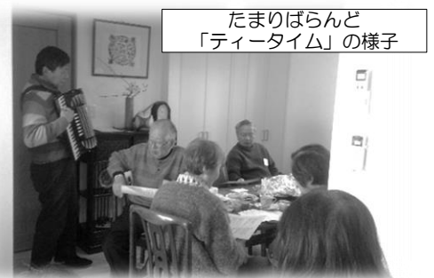
たまりばらんど「ティータイム」の様子