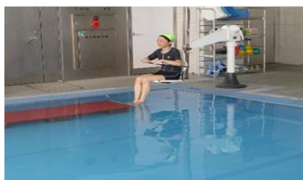
リフトがあるので車イスの方も 安心して利用できます