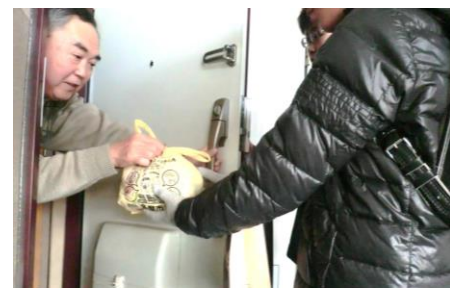
「お願いしますよ」「はい！」ごみの受けとり