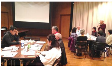
熱心に意見交換する参加者の皆さん