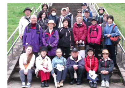
夕日の丘公園にて

万葉の歌碑があり、明治天皇の行幸を記念して建てられた聖蹟記念館など、関戸とはまた違った趣の残る連光寺地区を歩きました。時期がちょっとずれていたため満開の桜を見ることはできませんでしたが、それでも名残の桜はなかなか風情がありました。途中から市の学芸員さんに記念館が作られたいきさつなどを聞き、認識を新たにすることができました。