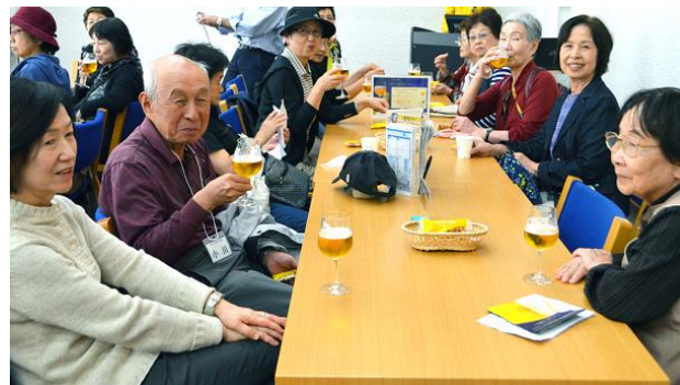
サントリー武蔵野ビール工場にて

時には対岸にも足を延ばしてみようと選んだのがこのコース。できたての美味しいビールを味わいながら歓談することができ、いつもより交流が深まったような気がします。ただし、帰りの歩く距離が長かっただけに、みなさん試飲は控え目だったようです。