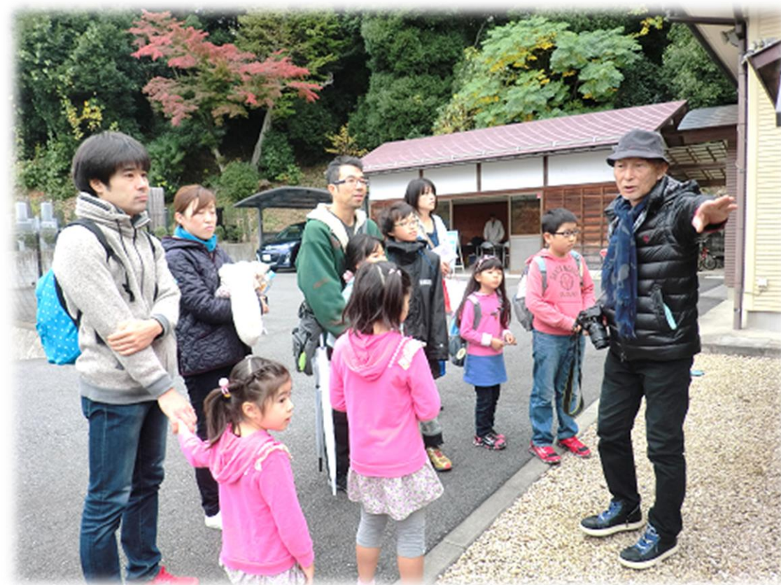
▲平成27年11月に開催した「子どものためのまち歩き」観音寺にて

まち歩きとは、街という空間を使った遊びの一種で、その歩き方はA地点からB地点までいかに面白く歩くかがコツです。普通の人の普通の暮らしが面白いという感覚で、そこで暮らす人々の生活にも思いを馳せながら歩きます。そんなふうにして歩いているうちに、自分たちの街をもっと暮らしやすくするにはどうすれば良いか、ということも見えてくるはずですよ。