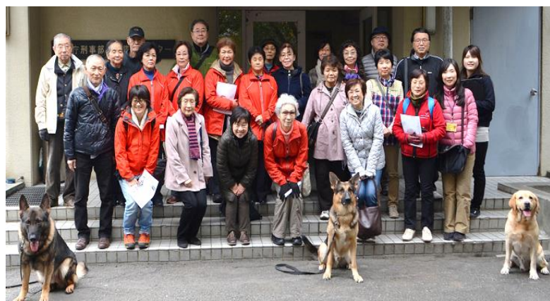
警視庁警察犬訓練所にて

防犯・防災をテーマに関戸2、3丁目を歩きました。こんな時でもなければ見ることでできない警視庁警察犬訓練所の視察はとても貴重な体験でした。多摩川堤防道路を歩いていたら、当時話題のスカイツリーがうっすらと見えて参加者同士で盛り上がりました。今となっては懐かしい思い出です。